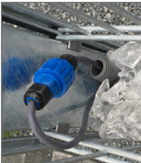
LED Beleuchtung in Glasschotter eingebettet