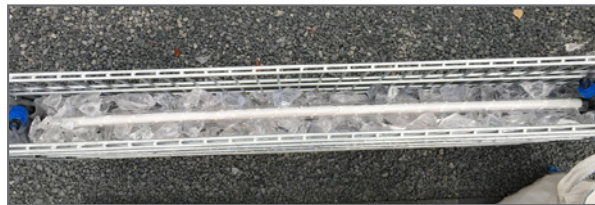
Master-Slave - an der einen Seite rein, an der anderen wieder raus zum nächsten Feld