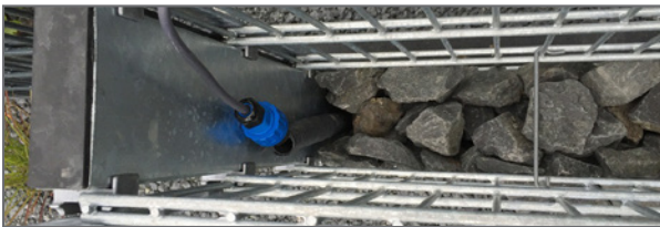
Gabione Erdkabel-Anschluss, Leuchtstabanschluss

Interessante Beleuchtung-Effekte: Bodeneinbauleuchten für Schotterbetten wie Hausumrandungen, Gartenteichumrandungen, Beeteinfassungen oder den Steingarten.