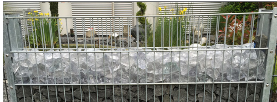
Gabionen-Leuchte komplett mit Glasschotter bedeckt - jetzt der restliche Schotter drauf